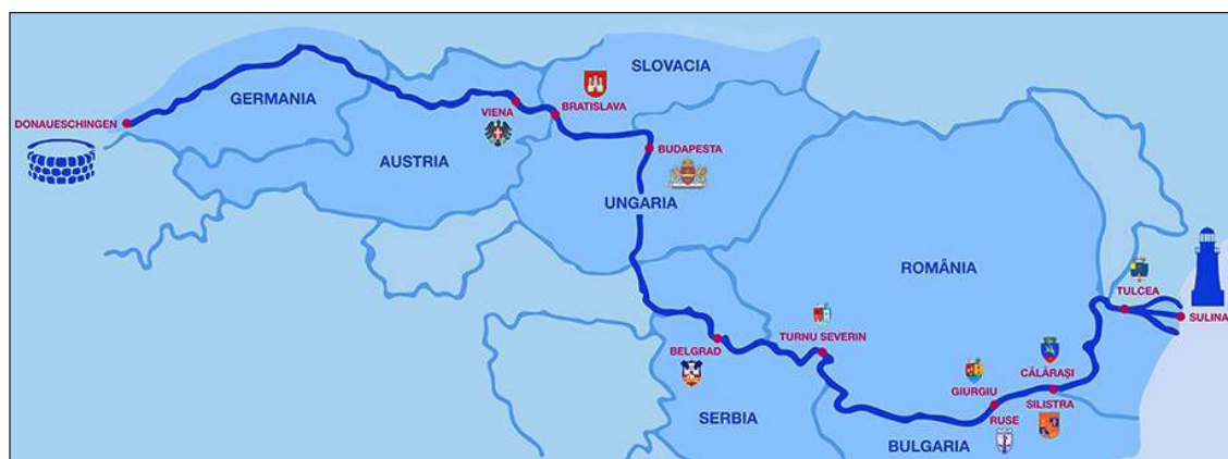
Figura 1. Dunărea europeană.

Dunărea, după cum s-a menționat, s-a format acum câteva milioane de ani, când s-au eliberat de ape și au ieșit la suprafață munții Carpați și când s-au retras din spațiile intramontane mările Badeniană, Sarmațiană, Meoțiană și Pontiană. În Cuaternar și-a făcut apariția în regiunile noastre omul. Într-un târziu, omul a dat nume obiectelor geografice din mediul ambiant, munților, râurilor, dealurilor, văilor etc. Cum se va fi numit inițial însuși fluviul, bineînțeles, nu se știe.