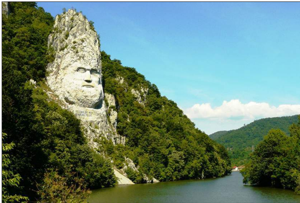
Figura 3. Dunărea la Cazane.

suprafața – 2,6 km 2 ), Congaz (1961, suprafața – 5,07 km 2 ), Taraclia (1988, suprafața – 15,1 km 2 ). Hidronimul a fost explicat prin cuman. jalpy „(râu, lac) în față, neadânc”.