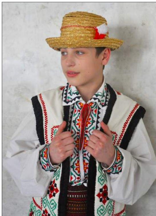
Mărțișorul, inclus de UNESCO în Lista reprezentativă a patrimoniului cultural imaterial al umanității.